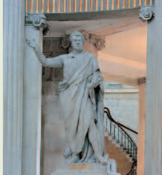
LA STATUA DI DANIEL O'CONNELL

praticamente inattivo. L'edificio venne salvato dal Dublin Corporation (Comune di Dublino) che lo acquistò nel 1851 e lo convertì ad uso dell'amministrazione comunale, creando poi spazi adibiti a uffici, divenuti indispensabili. Le modifiche comprendevano pareti divisorie nell'ambulacro, la costruzione di una nuova scala che dalla Rotonda conduceva ai piani superiori e la suddivisione delle volte in spazi adibiti a deposito. Il 30 settembre del 1852 il Royal Exchange ospitò la prima seduta della giunta comunale e in tale occasione fu ribattezzato City Hall.