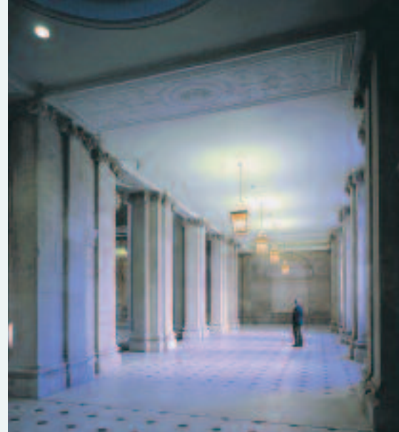
VISTA DELL'AMBULACRO SUL LATO OVEST

La City Hall ebbe un ruolo importante nello sviluppo del nazionalismo irlandese. I funerali degli illustri patrioti Charles Stewart Parnell e Jeremiah O'Donovan Rossa si svolsero qui e l'edificio fu presidiato dai ribelli durante la Rivolta di Pasqua del 1916, evento commemorato da una targa all'ingresso. Nel 1922, la City Hall diventò la sede temporanea del Governo Provvisorio irlandese guidato dal suo presidente Michael Collins; e fu qui che nello stesso anno si tenne il suo funerale insieme a quello del collega Arthur Griffith.