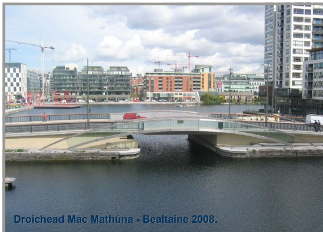
Droichead Mac Mathúna - Bealtaine 2008.