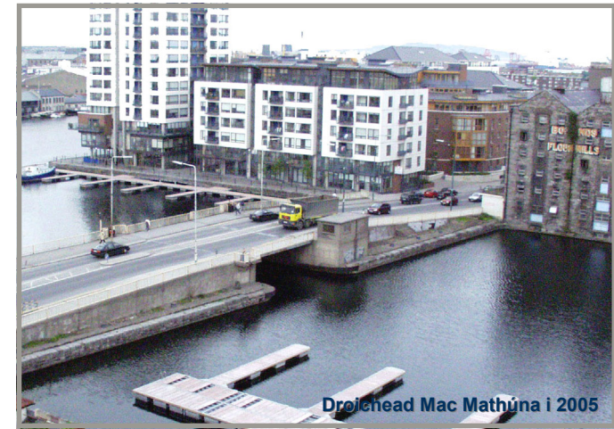
Droichead Mac Mathúna i 2005