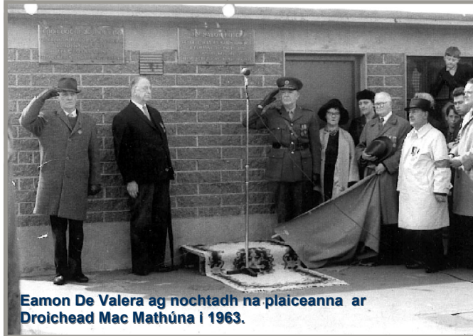
Eamon De Valera ag nochtadh na plaiseanna ar Droichead Mac Mathúna i 1963.

I Lúnasa 1960 cheadaigh an tAire Rialtais áitiúil an conradh do thógáil droichid nua den chineál luascach ar £57,000, ag Báisín na Canálach Móire, le tógáil ag an gcuideachta Gearmánach Machine-Fabrik. Ba é seo an ceathrú droichead ag an láthair seo, agus bhí sé ar insí ar thaobh amháin. Thug Córas Iompar Éireann (C.I.E.) £17,500 den chostas agus tháinig an fuilleach ó Bhardas Bhaile átha Cliath. Osclaíodh an droichead ar an 1 Feabhra 1963. Athainmníodh é mar Droichead Mac Mathúna i gcuimhne ar an nGinearál Seán Mac Mathúna a throid le hEamon de Valera ag Muille Uí Bheoláin agus a bhí mar Cheann Foirme ar Arm na héireann ina dhiaidh sin.