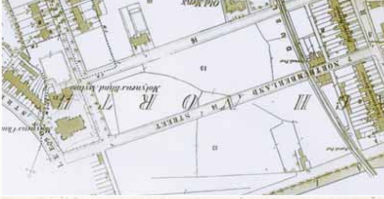
Léarscáil SO Foilsithe 1866 (Suirbhé deanta 1865).

Tugtar le fios go bhfuil dha shruth sa llimistéar Caomhantais Ailtireachta, ach níl ceachtar díobh seo le feiceáil ar léarscáil SO na bliana 1865. B'fhéidir go raibh stad faoi thalamh cheana féin faoin am seo, clúdaithe de bharr gníomhachtaí dumpála nó teoraithe chuing draein bhosca agus gan feiceáil orthu feasta os cionn talún le haghaidh shuirbhé SO na bliana 1865.