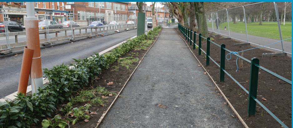
Tá dul chun cinn mór déanta ag oibreacha ar an taobh Isteach go dtí an chathair trí Fhionradharc agus an Pháirc