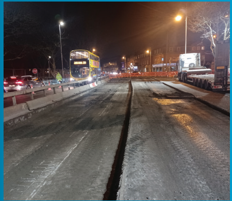
Leantar leis an mbóthar a atógáil ag gach ceann de na hacomhail mhóra feadh an bhealaigh