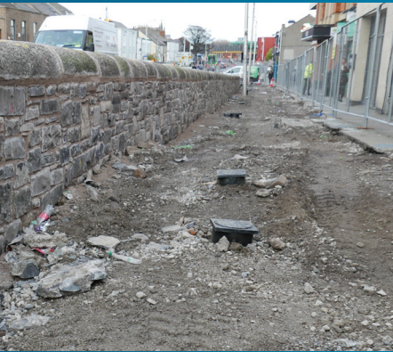
Atógadh an balla cloiche stairiúil ar Bhóthar na Trá Thuaidh