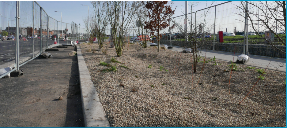
Leantar leis an bpábháil agus an tírdhreachú feadh an bhealaigh