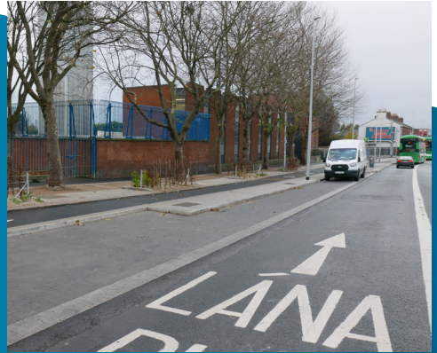
Páirceáil Phoiblí oscailte agus réimsí Bithchoinneála Draenála Uirbí Inbhuanaithe curtha i bhfeidhm ag Stáisiún Dóiteáin na Trá Thuaidh