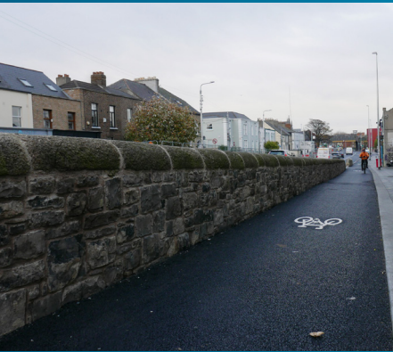
Balla cloiche stairiúil atógtha le rothar-raon oscailte ar Bhóthar na Trá Thuaidh