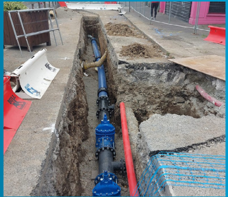
Tá thart ar 6km de phríomhlíonra uisce nua le cur isteach in ionad an phríomhlíonra atá ann le 100 bliain ar fud an bhealaigh