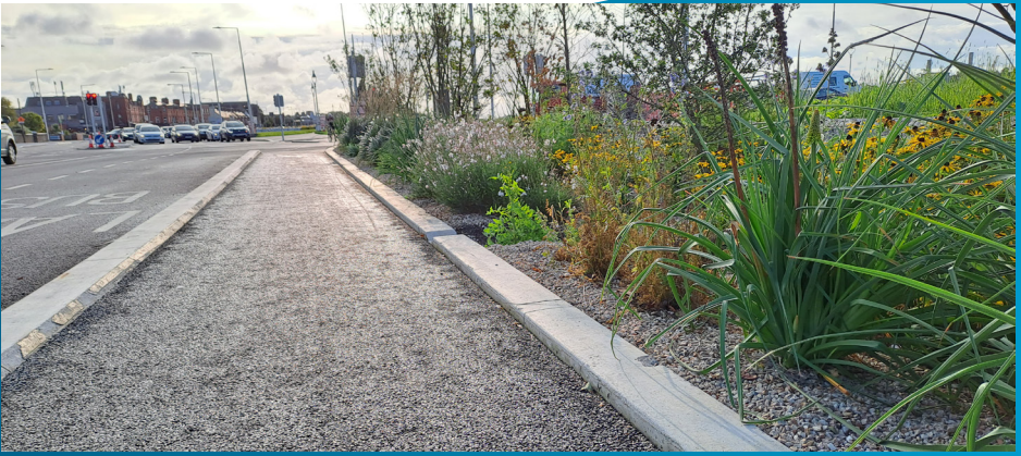
Leantar den phábháil agus den tírdhreachú ar fud an bhealaigh