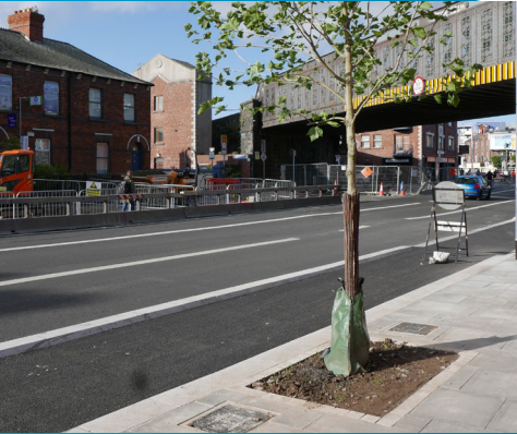
Tá poill chrainn shaincheaptha á lonnú chun tacú leis na crainn nua ar an scéim