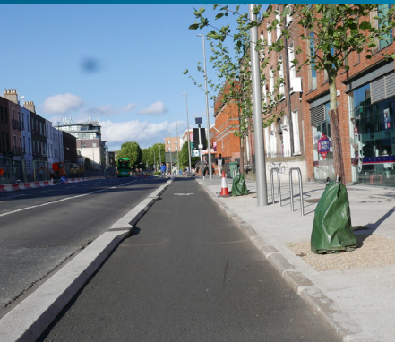
Tá Pábháil, Plandáil agus rothar-raon nua ann anois le húsáid ag an bpobal