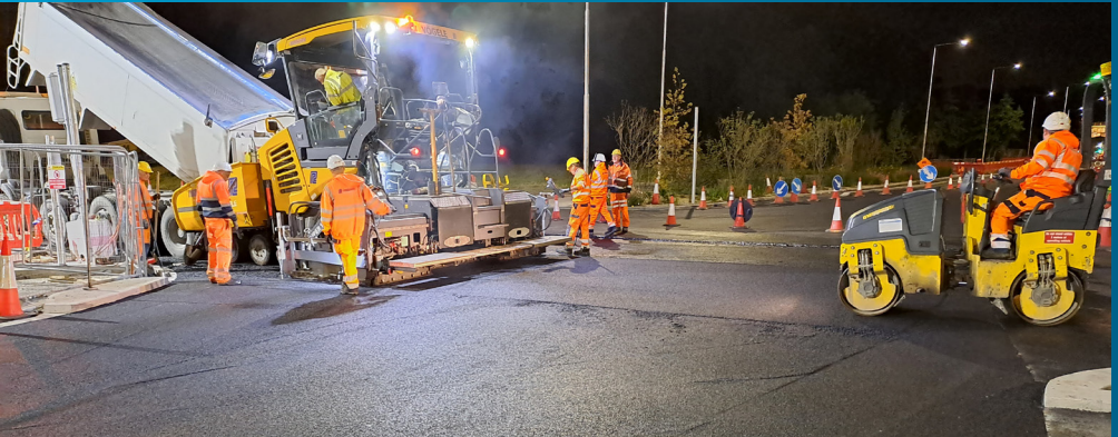
Leanúint d'atógáil an bhóthair ag gach ceann de na hacomhail mhóra ar fud an bhealaigh