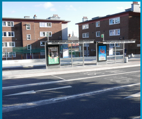
Tá seacht gcinn de na stadanna bus ar an mbealach críochnaithe agus tá siad oscailte