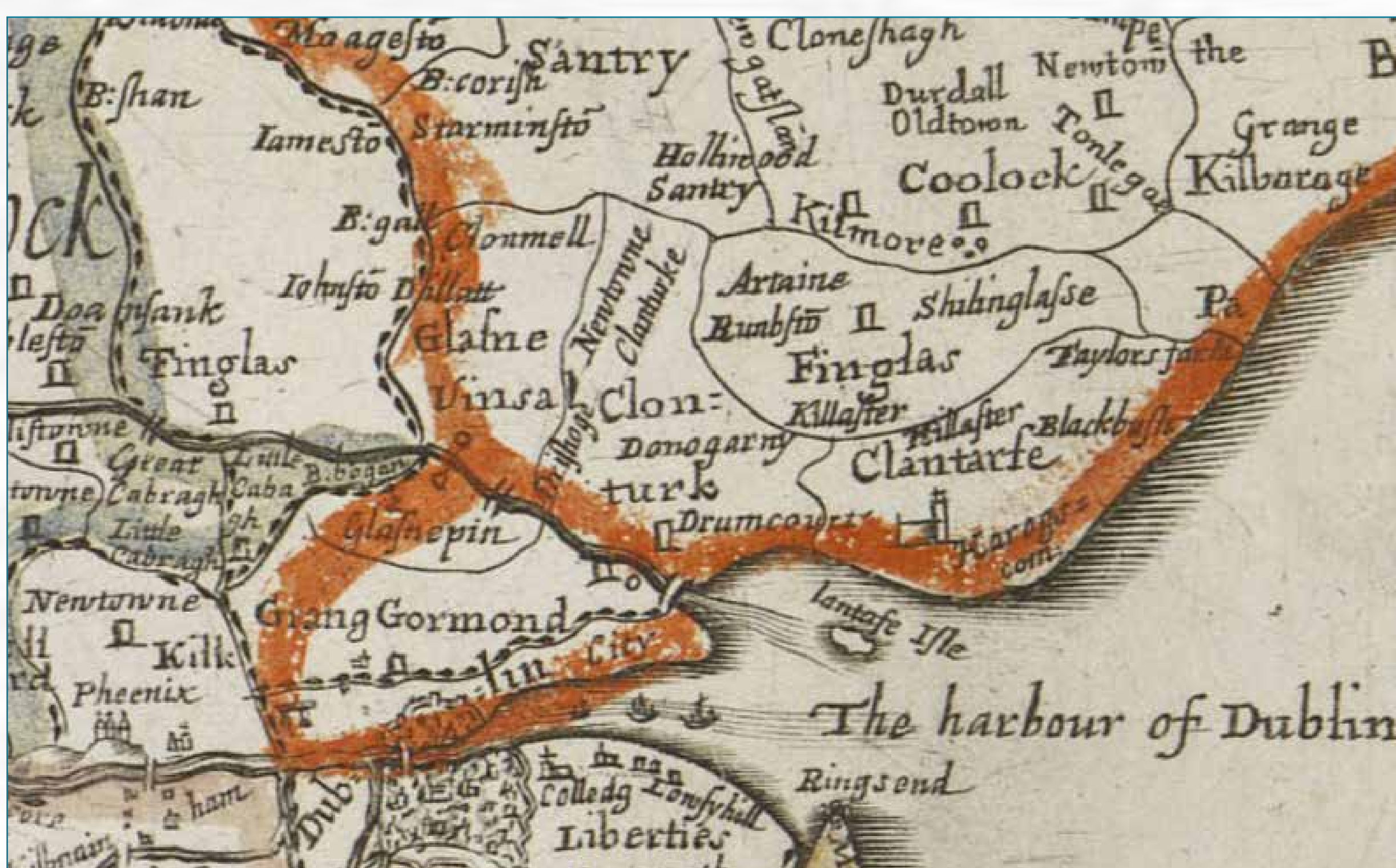
Sliocht ó léarscáil Down Survey Chontae Bhaile Átha Cliath, c. 1656, ina léirítear an logainm Domhnach Cearna (léarscáil Down Survey Chontae Bhaile Átha Cliath)