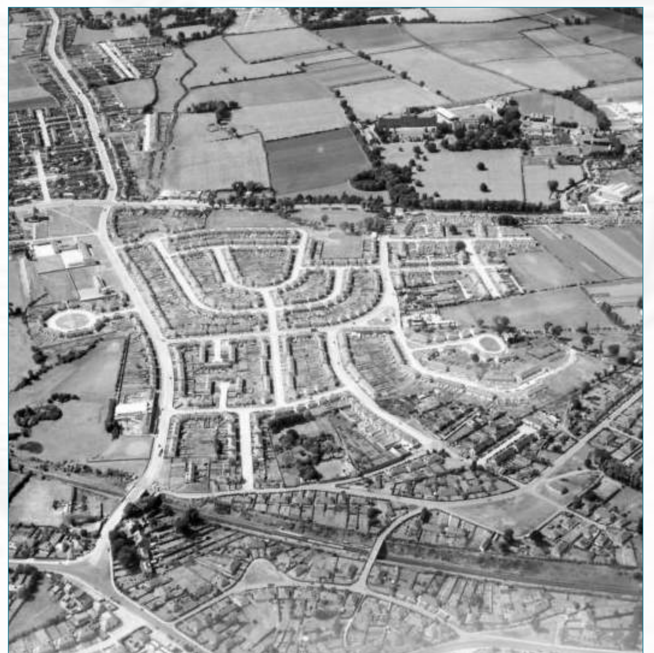
Tá seans ann gurb in an íomhá is léirsteanaí maidir le forbairt Dhomhnach Cearna san fhichiú haois. Úsáidtear é i leabhar Chill Easra, lch. 109. | Íomhá © Sasana Stairiúil | Foinse: www.britainfromabove.org.uk/image/XAW044960