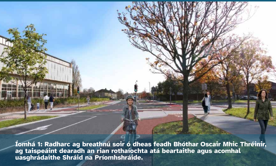
Íomhá 1: Radharc ag breathnú soir ó dheas feadh Bhóthar Oscair Mhic Thréinir, ag taispeáint dearadh an rian rothaíochta atá beartaithe agus acomhal uasghrádaithe Shráid na Príomhshráide.