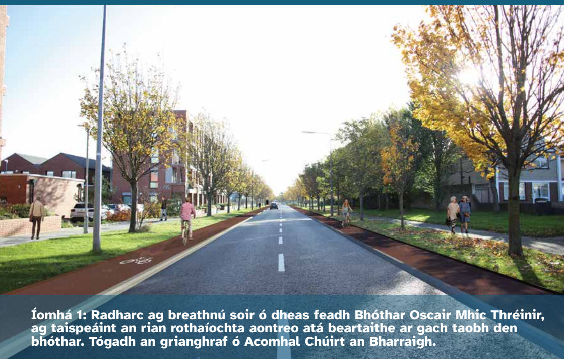
Íomhá 1: Radharc ag breathnú soir ó dheas feadh Bhóthar Oscair Mhic Thréinir, ag taispeáint an rian rothaíochta aontreo atá beartaithe ar gach taobh den bhóthar. Tógadh an grianghraf ó Acomhal Chúirt an Bharraigh.